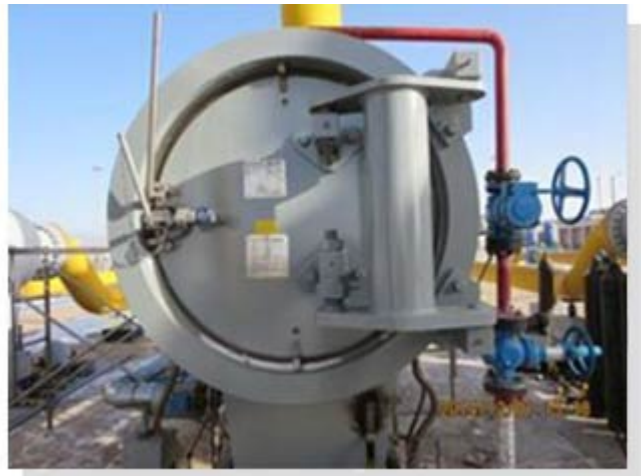
西气东输玉门压气站